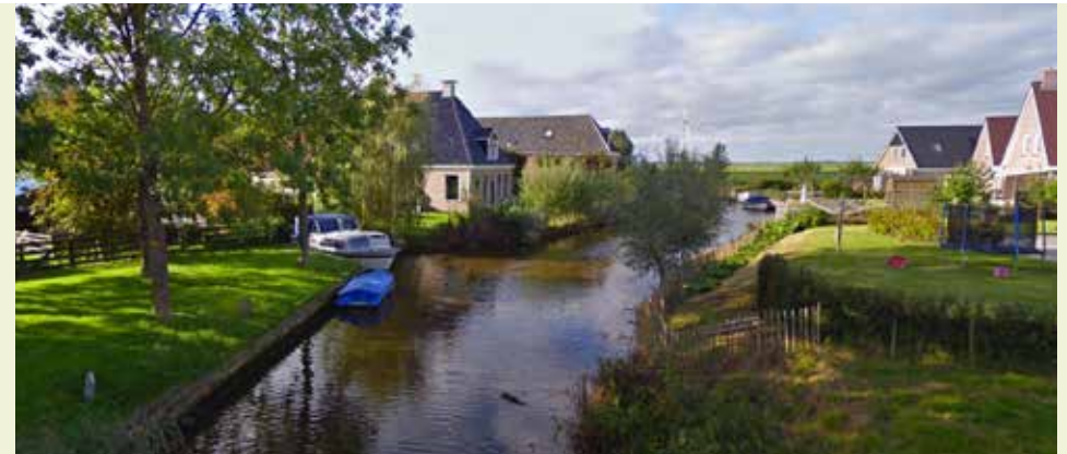
De Baarder sleat... toekomstige bron van energie?

Duurzaam Bouwloket | Leeuwarden Subsidiecheck | Duurzaam Bouwloket https://www.rvo.nl/subsidie-en-financieringswijzer/isde/isde-wijzigingen-2022 https://www.rvo.nl/subsidie-en-financieringswijzer/isde ISDE: Isolatiemaatregelen woningeigenaren aanvragen | RVO.nl | Rijksdienst SDE Maatregelenlijst Isolatiematerialen 2022 (rvo.nl)