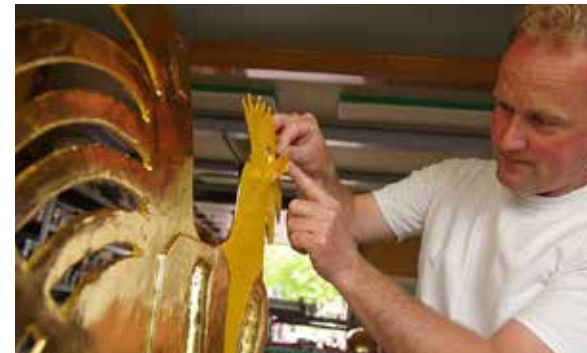
De haan wordt voorzien van nieuw bladgoud

We ha him tige mist. Elkenien frege wannear de hoanne werom kaam. It frjemde is, no't der werom is gjinien mear sjocht dat ie der is. It falt net mear op.