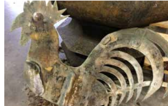
De haan voor de restauratie